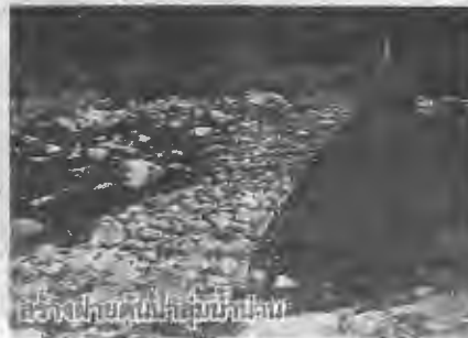
ลำน้ำสายต้นน้ำเขตรักษาพันธุ์สัตว์ป่าห้วยขาแข้ง