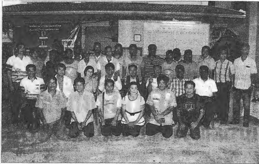
ผลงาน : นายชัย พรหมนันทชัย รองอธิบดีกรมส่งเสริมการเกษตร นำคณะสื่อมวลชนดูงานการผลิต มังคุดคุณภาพ ณ วิทยาลัยชุมชนกลุ่มมังคุด ศูนย์เรียนรู้การเกษตรท่ามะพร้าว จ.สุพรรณ