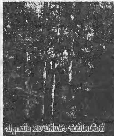
ปลูกเมื่อ 20ปีที่แล้ว ไม้โตเต็มที่

ทางวิชาชีพโดยหลีกเลี่ยงการ ตัดไม้ หรือทำลายลูกไม้ ชุด หลุมและพรวนดินให้กว้าง ลึกประมาณ 1 ฟุต รองกัน หลุมด้วยอินทรียัดตุ บั๊ย คอกหรือ สารโพลีเมอร์ เพื่อ ให้อุ้มน้ำและเพิ่มสารอาหาร ใช้พันธุ์ไม้ที่มีอยู่เดิมใน พื้นที่เป็นหลักมาปลูกเฉลี่ย 120-150 ต้นต่อไร่ ปลูก ปะปนไม่ปนเป็นแถวเป็นแนว