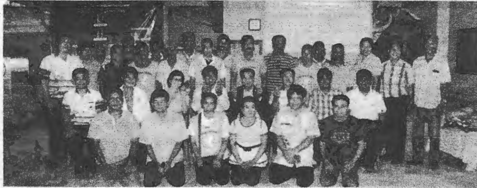
ศูนย์เรียนรู้การเกษตร ● นายนำชัย พรหมมีชัย รองอธิบดีกรมส่งเสริมการเกษตร นำคณะสื่อมวลชนดู งานการผลิตมังคุดคุณภาพ ณ วิสาหกิจชุมชนกลุ่มมังคุด ศูนย์เรียนรู้การเกษตรท่ามะปลา จ.ชุมพร เมื่อวันที่ 8 กันยายน 2557