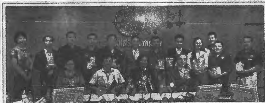
ต้อนรับคณะต่างประเทศ.....นางบริสุทธิ์ เปรมประพันธ์ รองอธิบดีกรมส่งเสริมสหกรณ์ ให้การต้อนรับคณะผู้เข้ารับการอบรม จากประเทศภูฏาน กัมพูชา ลาว เวียดนาม มาเลเซีย และเวียดนาม เพื่อเรียนรู้ระบบการสหกรณ์ในประเทศไทยและศึกษานโยบายของหน่วยงานภาครัฐที่ส่งเสริมงานสหกรณ์และกลุ่มเกษตรกร ณ กรมส่งเสริมสหกรณ์ เทเวศร์ กรุงเทพมหานคร เมื่อวันก่อน