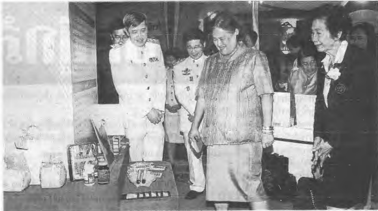
สมเด็จพระเทพรัตนราชสุดาฯ สยามบรมราชกุมารี เสด็จพระราชดำเนินไปทรง เปิดการประชุมวิชาการข้าวแห่งชาติ ครั้งที่ 3 "ข้าวไทยสู่สากลโลก" ณ โรงแรมมิราเคิล แกรนด์ คอนเวนชัน เมื่อวันที่ 11 กันยายน