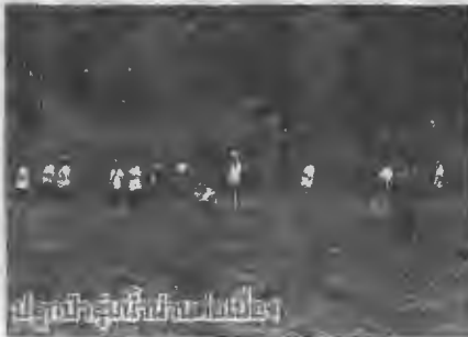
ปลูกป่าชุมชนที่ตำบลโป่งน้ำร้อน