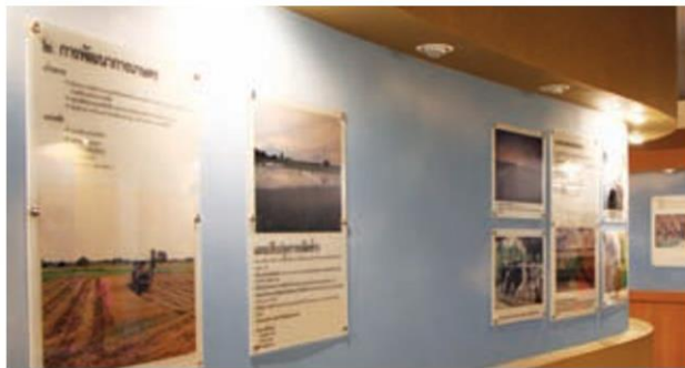
บรรยากาศภายในพิพิธภัณฑ์

เรื่องราวความเป็นมาของเขื่อนปากพนังและโครงการพัฒนาพื้นที่ลุ่มน้ำปากพนังฯ นั้นสามารถเข้าไปชมได้อย่างละเอียดที่ "พิพิธภัณฑ์เฉลิมพระเกียรติ โครงการพัฒนาพื้นที่ลุ่มน้ำปากพนังฯ" ใน อ.ปากพนัง จ.นครศรีธรรมราช ซึ่งเป็นพิพิธภัณฑ์ที่เกิดจากโครงการพัฒนาพื้นที่ลุ่มน้ำปากพนังอันเนื่องมาจากพระราชดำริของในหลวง ด้วอาคารพิพิธภัณฑ์ตั้งอยู่ในบริเวณสถานที่ดำเนินโครงการพื้นที่ลุ่มน้ำปากพนัง ประกอบด้วยห้องทรงงานส่วนพระองค์ ห้องประชุมและห้องนิทรรศการปากพนัง