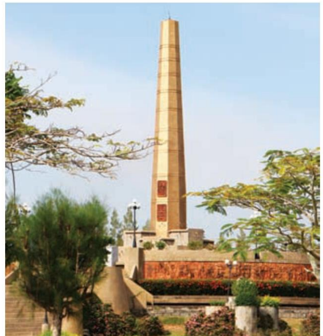
"อนุสาวรีย์ปล่องโรงสีข้าวโบราณ" ในพิพิธภัณฑ์

และสุดท้ายเป็นส่วนของการจัดแสดงผลสำเร็จหลังโครงการเสร็จสิ้น และโครงการอันเนื่องมาจากพระราชดำริที่สำคัญในภาคใต้ และบริเวณใกล้ๆ กับพิพิธภัณฑ์ฯ ยังมี "อนุสาวรีย์ปล่องโรงสีข้าวโบราณ" ที่ตั้งเด่นเป็นสง่าให้ได้ชมกัน ซึ่งปล่องโรงสีข้าวโบราณนี้ ถือว่าเป็นสัญลักษณ์แห่งปากพนังที่แสดงให้เห็นว่าในอดีตปากพนังมีความอุดม