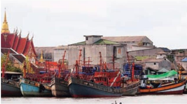
วิถีชีวิตในแม่น้ำปากพนัง

หัวข้อข่าว: ด้วยพระมหากรุณาธิคุณ...ฟื้นคืน"ปากพนัง"