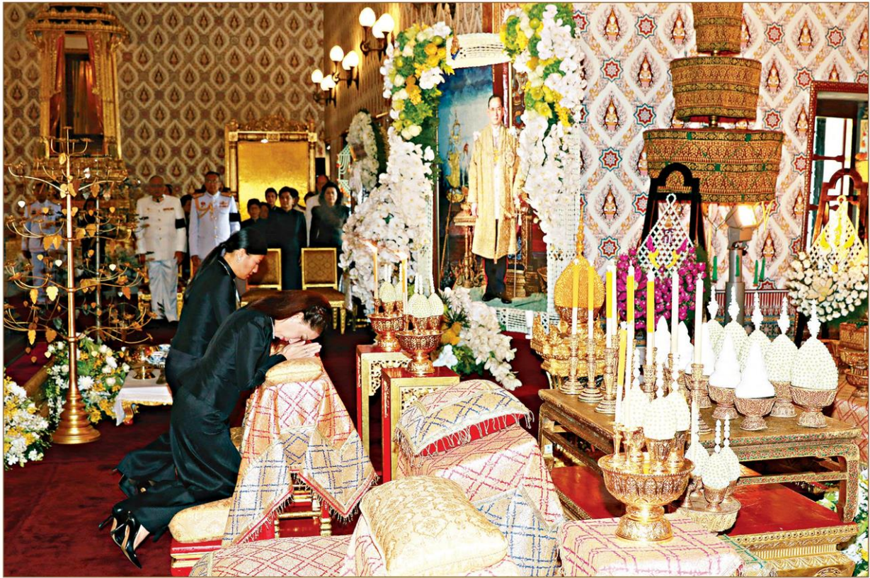
พระเจ้าหลานเธอ พระองค์เจ้าพัชรกิติยาภา และ พระเจ้าหลานเธอ พระองค์เจ้าสิริวัณณวรีนารีรัตน์ เสด็จไปทรงบำเพ็ญพระราชกุศลถวายภัตตาหารเพลแด่พระสงฆ์ ในการพระราชพิธีธรรมสวดพระอภิธรรมพระบรมศพ พระบาทสมเด็จพระปรมินทรมหาภูมิพลอดุลยเดช มหิตลาธิเบศรรามาธิบดี จักรีนฤพดินทราธิราชสยามมหาราชินีบรมนาถบพิตร ณ พระที่นั่งดุสิตมหาปราสาท ในพระบรมมหาราชวัง