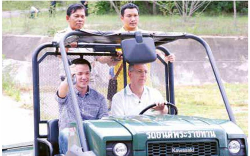
ท่านทูต พิธีกร ผู้อำนวยการโครงการฯ และเจ้าหน้าที่ขับรถโฟร์วีลไปยังอ่างเก็บน้ำ

ศูนย์การเรียนรู้ปลูกผักปลอดภัยของ สด นิจก หรือลุงสด เกษตรกรรุ่นแรกที่ได้รับพระราชทานบ้านมุงหญ้าคาพร้อมที่ดินทำกินอีก 18 ไร่ ปัจจุบัน