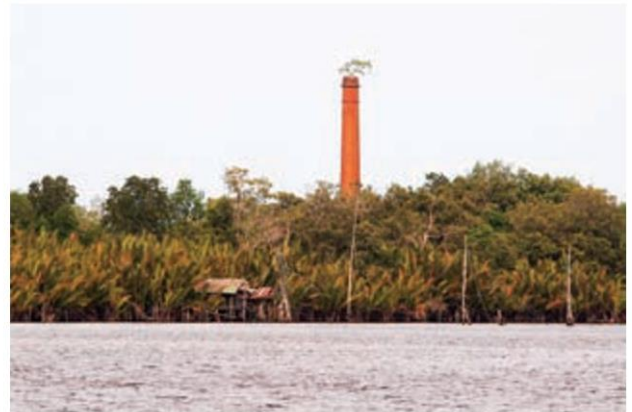
โรงสีข้าวที่ไม่ได้ใช้งานริมแม่น้ำปากพนัง

ภายในห้องนิทรรศการจัดแสดงได้อย่างน่าสนใจผ่านสื่อมัลติมีเดีย โดยมีเรื่องราวความมากมายเกี่ยวกับโครงการพัฒนาพื้นที่ลุ่มน้ำปากพนังฯ จัดแสดงไว้ให้ได้ศึกษากัน ตั้งแต่พาไปย้อนอดีตสู่ลุ่มน้ำปากพนังที่เคยรุ่งโรจน์ทางด้านเกษตรกรรม เป็นอยู่ชาวอู่น้ำของพื้นที่ภาคใต้ ก่อนที่จะประสบกับสภาพปัญหาต่างๆ และสาเหตุของปัญหาที่เกิดขึ้นกับพื้นที่ในโครงการฯ จากนั้นก็จัดแสดงให้เห็นถึงพระมหากรุณาธิคุณของในหลวงที่มีต่อพื้นที่โครงการฯ และมีการนำเสนอแผนการดำเนินงานโครงการพัฒนาพื้นที่ลุ่มน้ำปากพนัง อันเนื่องมาจากพระราชดำริ