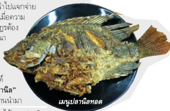
เมนูปลานิลทอด

"ก็เลี้ยงมันมาเหมือนลูก แล้วจะกินมันได้อย่างไร".