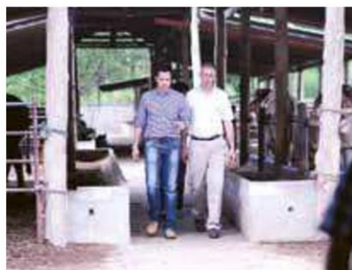
ฟาร์มและศูนย์เรียนรู้การเลี้ยงโคขุน

มีกำหนดระยะเวลาดำเนินการ 5 ปี โดยใช้ชื่อว่า “โครงการไทย-อิสราเอล เพื่อพัฒนาชนบท (หุบกะพง)”