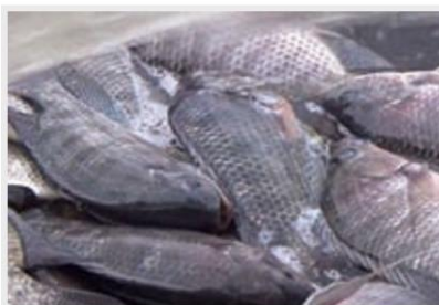
ปลานิลปลาพระราชทานจากในหลวงรัชกาลที่ 9

หลังจากทรงได้รับการทูลเกล้าฯ ถวายปลานิล พระบาทสมเด็จพระปรมินทรมหาภูมิพลอดุลยเดช ให้นำปลานิล ไปปักเลี้ยงไว้ในบ่อปลาสวนจิตรลดาฯ และได้มีพระราชกระแสรับสั่งให้กรมประมงเพาะ