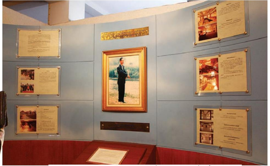
พระบรมฉายาลักษณ์ของในหลวงรัชกาลที่ 9 ขณะทรงงานที่ลุ่มน้ำปากพนัง