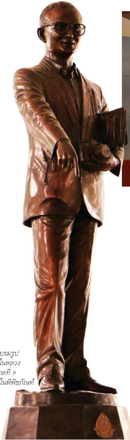
พระบรมรูป ของในหลวง รัชกาลที่ 9 ภายในพิพิธภัณฑ์

หัวข้อข่าว: ด้วยพระมหากรุณาธิคุณ...พื้นดิน“ปากพนัง”