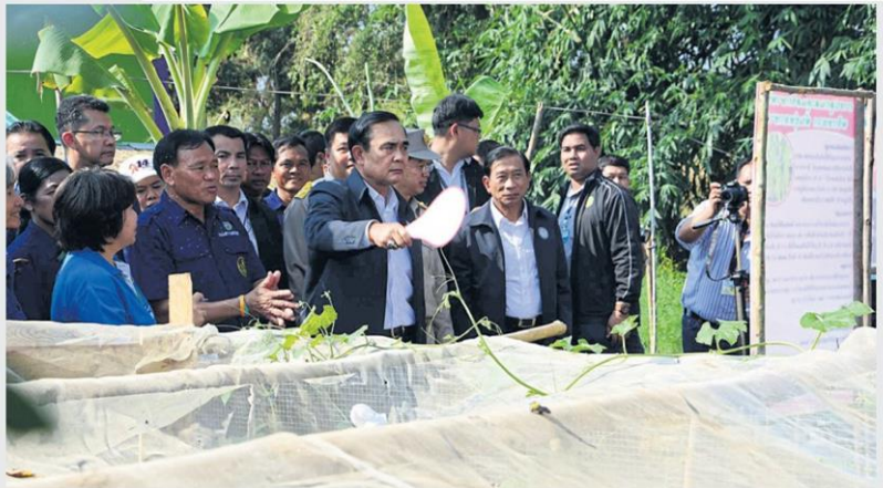
พล.อ.ประยุทธ์ จันทร์โอชา นายกรัฐมนตรี เยี่ยมศูนย์เรียนรู้การเพิ่มประสิทธิภาพ การผลิตสินค้าเกษตร อ.บรรพตพิสัย จ.นครสวรรค์ เมื่อต้นปีที่ผ่านมา

ไม่พอจะให้หน่วยงานที่เกี่ยวข้องช่วย ดูแล โดยจะมีรายการให้เลือกทั้งกลุ่ม พืช ปศุสัตว์ ประมง ให้ตรงกับความ ต้องการของเกษตรกรจริงๆ