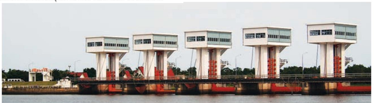
ประตูระบายน้ำอุทกวิภาชประสิทธิ์ หรือเขื่อนปากพนัง

และสุดท้ายเป็นส่วนของการจัดแสดงผลสำเร็จหลังโครงการเสร็จสิ้น และโครงการอันเนื่องมาจากพระราชดำริที่สำคัญในภาคใต้ และบริเวณใกล้ๆ กับพิพิธภัณฑ์ฯ ยังมี "อนุสาวรีย์ปล่องโรงสีข้าวโบราณ" ที่ตั้งเด่นเป็นสง่าให้ได้ชมกัน ซึ่งปล่องโรงสีข้าวโบราณนี้ ถือว่าเป็นสัญลักษณ์แห่งปากพนังที่แสดงให้เห็นว่าในอดีตปากพนังมีความอุดม