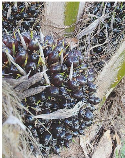
ปาล์มน้ำมัน

เมื่อเทียบกับเดือนสิงหาคม 2559 ที่ผ่านมา สินค้าที่มีราคาปรับตัวลดลง ได้แก่ ข้าวเปลือกเจ้าความชื้น 15% มันสำปะหลัง ข้าวโพดเลี้ยงสัตว์ ยางพารา สับปะรดโรงงาน สุกอร์ โดยข้าวเปลือกเจ้าความชื้น 15% มันสำปะหลัง และข้าวโพดเลี้ยงสัตว์ ราคาลดลงเนื่องจากผลผลิตออกสู่ตลาดมากกว่าเดือนที่ผ่านมา และฝนตก