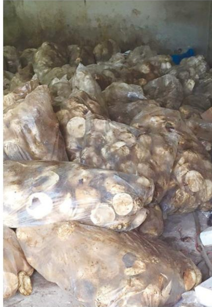
ยางก่อนวัย

สิงหาคม 2559 ที่ผ่านมา เพิ่มขึ้นร้อยละ 18.37 สินค้าสำคัญที่ผลผลิตเพิ่มขึ้น ได้แก่ ข้าวเปลือกเจ้า ข้าวโพดเลี้ยงสัตว์ ยางพารา สับปะรดโรงงาน และปาล์มน้ำมัน สินค้าสำคัญที่ผลผลิตลดลง ได้แก่ ทูเรียน