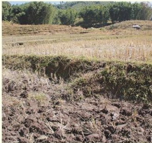
ดินดีมีผลจากอากาศดี