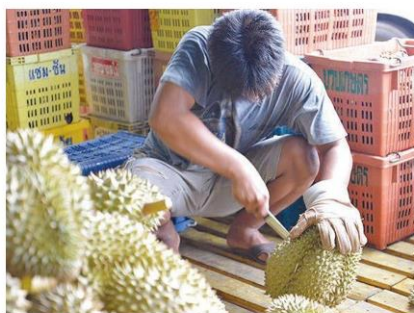
ปอกทุเรียนขาย

เดือนที่ผ่านมา ประกอบกับความต้องการของผู้บริโภคลดลง