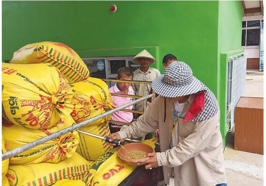
ตรวจสอบคุณภาพข้าว

ทำให้คุณภาพไม่ค่อยดี ยางพารา ราคาลดลงเนื่องจากผลผลิตออกสู่ตลาดมากกว่าเดือนที่ผ่านมา และราคาน้ำมันดิบปรับตัวลดลง สับปะรดโรงงาน และปาล์มน้ำมัน ราคาลดลงเนื่องจากผลผลิตออกสู่ตลาดมากกว่าเดือนที่ผ่านมา สุกอร์ ราคาลดลงเนื่องจากผลผลิตออกสู่ตลาดมากกว่า