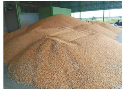
ข้าวโพดเลี้ยงสัตว์

สำปะหลัง และข้าวโพดเลี้ยงสัตว์ ราคาลดลงเนื่องจากผลผลิตเพิ่มขึ้นจากช่วงเดียวกันของปีที่ผ่านมา ประกอบกับการนำเข้าข้าวสาลี มาทดแทนมันสำปะหลังและข้าวโพดเลี้ยงสัตว์ ในอุตสาหกรรมอาหารสัตว์