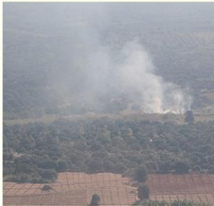
การเกษตรมีผลต่อสภาพสิ่งแวดล้อม