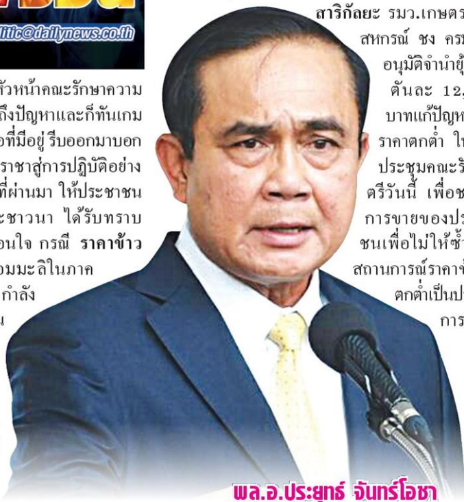
พล.อ.ประยุทธ์ จันทร์โอชา