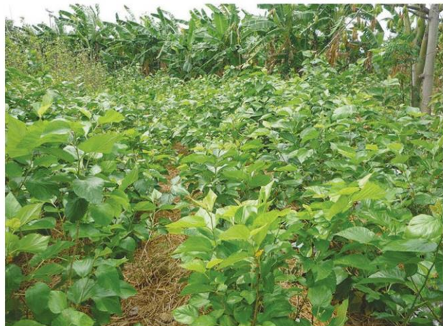
ลักษณะการปลูกที่เหมาะสม

โดยความรุนแรงของโรคนี้จะขึ้นอยู่กับปัจจัยหลายอย่าง เช่น พันธุ์หม่อน และการบริหารจัดการแปลงหม่อน ซึ่งใบหม่อนที่แสดงอาการรุนแรงจะมีคุณภาพต่ำไม่เหมาะสมที่จะนำไปเลี้ยงไหม และอาจจะอันตรายต่อไหมได้