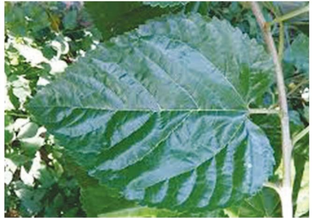
ใบหม่อนที่สมบูรณ์