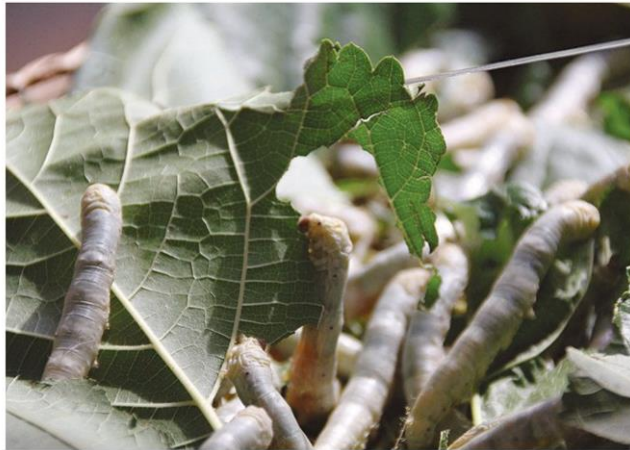
โหมกใบหม่อน