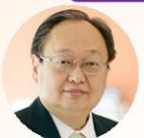
*นายสนธิรัตน์ สนธิจิรวงศ์ เป็น รมช.พาณิชย์