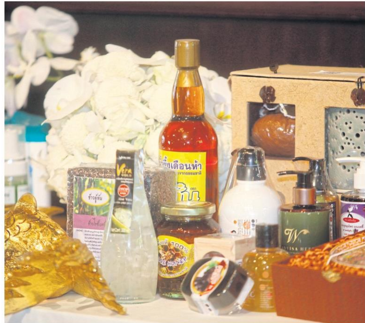
Otop City 2016 features more than 10,000 community products. THANARAK KHUNTON