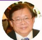
นายวีระศักดิ์ พุทธะกุล เป็น รมช.ต่างประเทศ