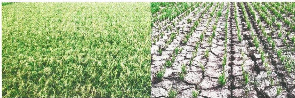
นาแปลงใหญ่ - พื้นที่แห้งแล้ง

พล.อ.ฉัตรชัย สาริกัลยะ รัฐมนตรีว่าการกระทรวงเกษตรและสหกรณ์ กล่าวในระหว่างการประชุมพิเศษเรื่อง “นโยบายรัฐในการลดพื้นที่นา” ว่าปัจจุบันประเทศไทยมีพื้นที่ข้าวกว่า 2 หมื่นสายพันธุ์ มีชาวนาที่มีวัฒนธรรมผูกพันกับการปลูกมานานถึงกว่า 3.7 ล้านครัวเรือน ทำให้ไทยมีศักยภาพมากพอที่จะตอบโจทย์การบริโภคข้าวของคนทั้งโลก การส่งออกข้าวของไทยจึงกลับมาเป็นที่ 1 อีกครั้ง และสร้างรายได้เข้าประเทศได้มากกว่า 2 แสนล้านบาท