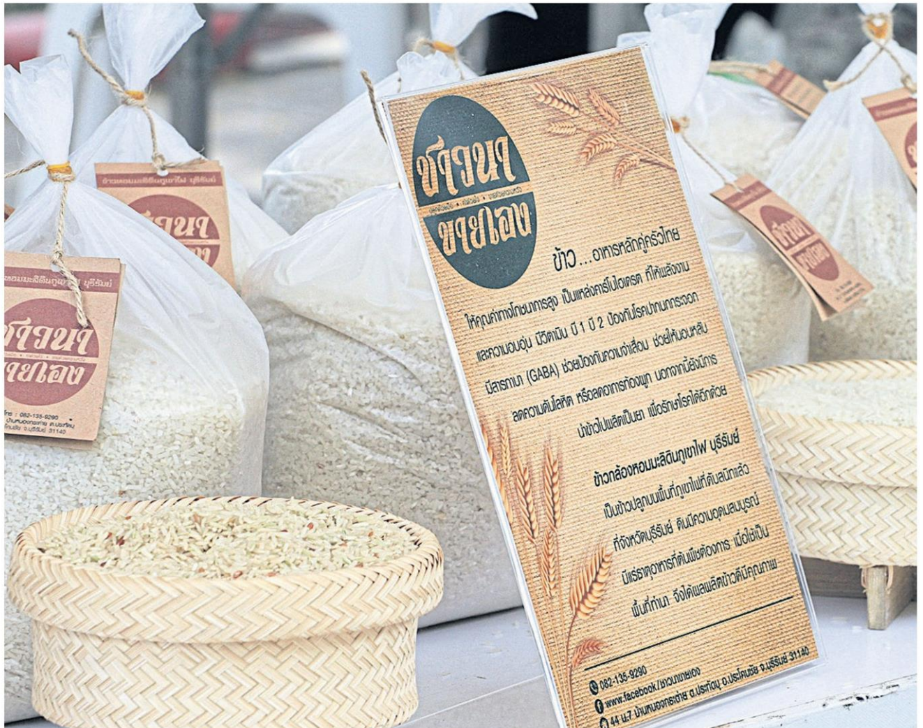
Central Group provides space at its retail chain for farmers to sell rice. PONGPAT WONGYALA