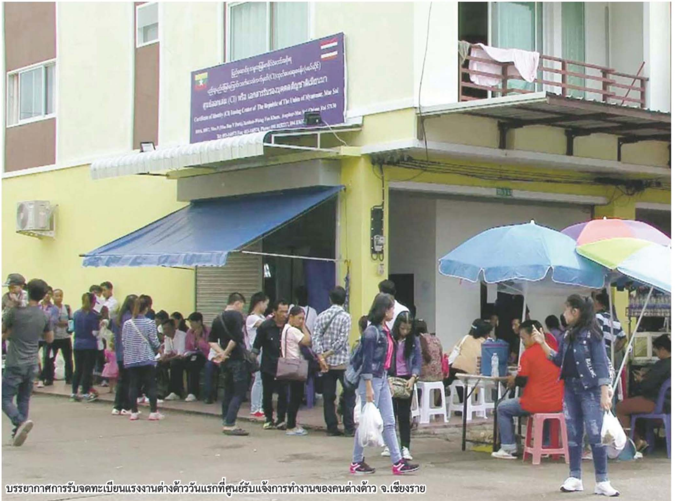
บรรยากาศการรับจดทะเบียนแรงงานต่างด้าววันแรกที่ศูนย์รับแจ้งการทำงานของคนต่างด้าว จ.เชียงราย

พิสูจน์สัญชาติของแต่ละประเทศแล้วขออนุญาตทำงานอย่างถูกต้องตามกฎหมายไทยต่อไป ส่วนการขออนุญาตทำงานแรงงานต่างด้าวด้วยระบบอิเล็กทรอนิกส์นั้น กระทรวงแรงงาน กำหนดแผนโครงการเริ่มในปีงบประมาณ 2561