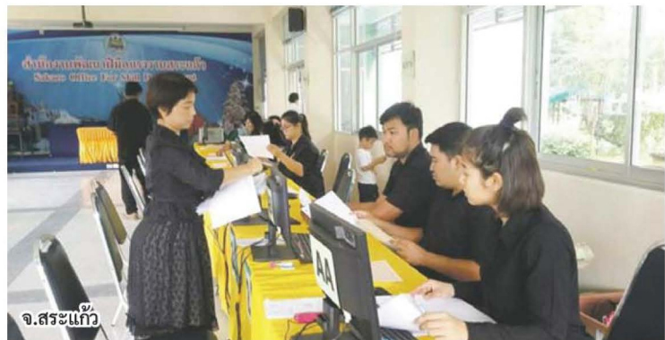
จ.สระแก้ว