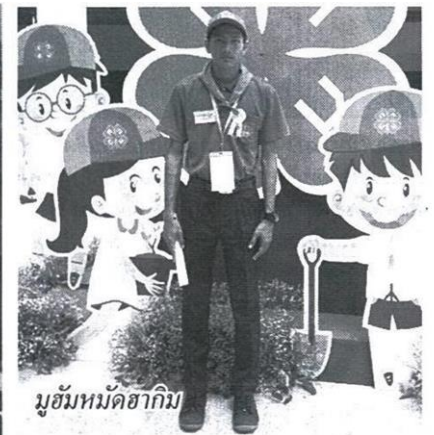
มุฮัมหมัดฮาгим