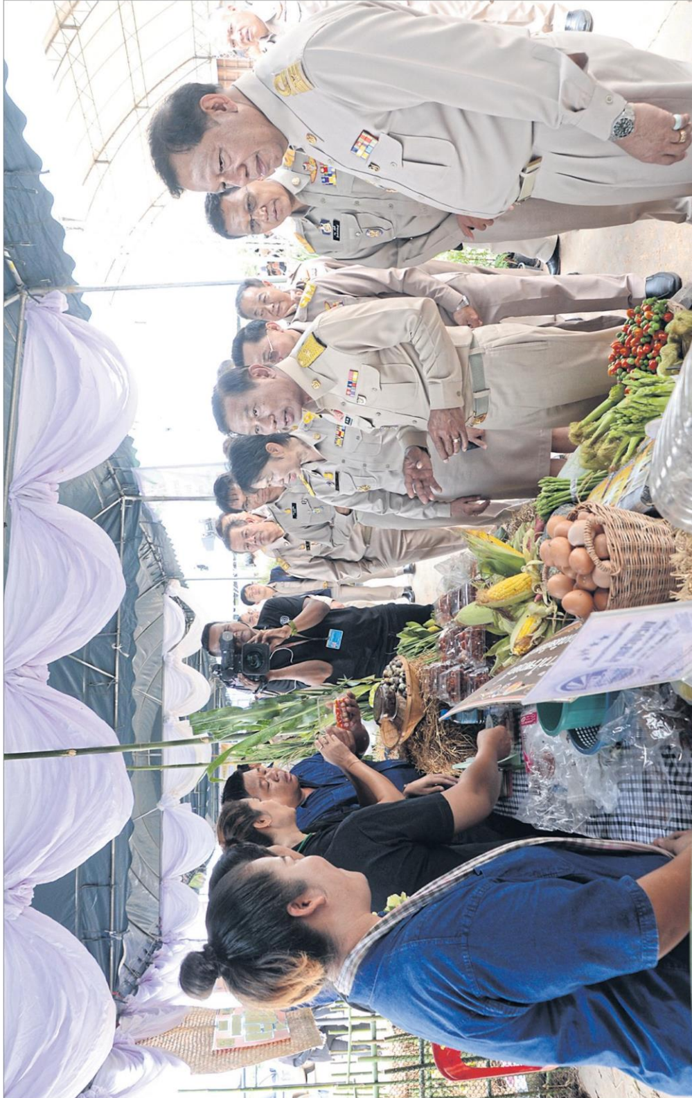
ดิกออฟ 9101 : พล.อ.ฉัตรชัย สาริกัลยะ รมว.เกษตรฯ เป็นประธานในพิธีเปิดโครงการ 9101 ตามรอยเท้าพ่อ ภายใต้ร่มพระบารมี เพื่อการพัฒนาการเกษตรอย่างยั่งยืน ณ ศพก. อ.หนองม่วง จ.ลพบุรี โดยได้กราบถวายความอาลัยเบื้องหน้าพระบรมฉายาลักษณ์ ร.9 พร้อมกล่าวถวายพระพร ร.10 และประกอบพิธีหล่อเทียนเปิดงาน ก่อนจะเดินพบปะเกษตรกร เยี่ยมชมกิจกรรมและรับฟังบรรยายสรุปผลความก้าวหน้าโครงการ