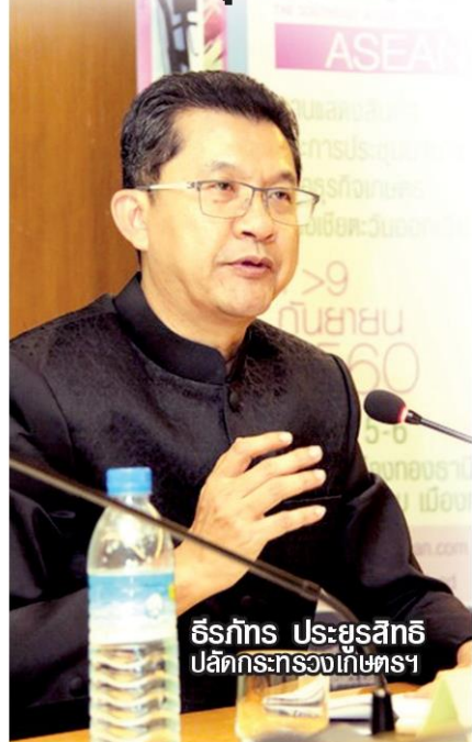
ธีรภัทร ประยูรสิทธิ ปลัดกระทรวงเกษตรฯ

กระทรวงเกษตรและสหกรณ์จัดงานแสดงสินค้าเพื่อธุรกิจการเกษตรที่ใหญ่ที่สุดในภูมิภาคอาเซียน รวมนวัตกรรมและเทคโนโลยีทันสมัยจากผู้ประกอบการไทยและต่างประเทศทั่วโลก สอดรับนโยบาย "Thailand 4.0" หนุนสร้างโอกาสและเครือข่ายธุรกิจการเกษตรไทยสู่ตลาดโลก