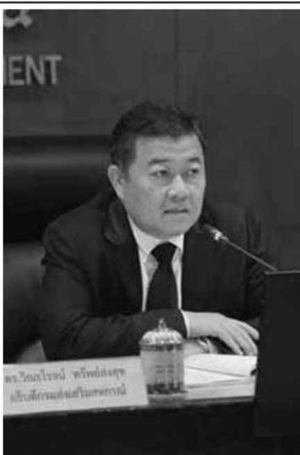
ดร.วิฑูรย์ ทรัพย์สงูช อธิบดีกรมส่งเสริมสหกรณ์ กล่าวระหว่างการประชุมเรื่องการใช้อำนาจนายทะเบียนสหกรณ์แก้ไขปัญหาสหกรณ์ว่า กรมส่งเสริมสหกรณ์ได้เรียกสหกรณ์จังหวัดทั่วประเทศมาทำความเข้าใจถึงแนวทางการทำงานของกรมฯ โดยนับจากนี้จะต้องปรับเปลี่ยนให้