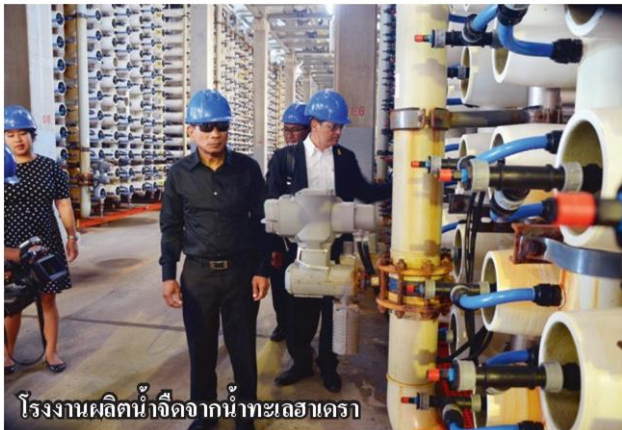
โรงงานผลิตน้ำจืดจากน้ำทะเลอาเดรา

การจัดการผลผลิตที่ยอดเยี่ยมของสหกรณ์ ดึงผลผลิต 90% ไปเข้าขบวนการจัดเก็บ แปรรูป และจัดจำหน่ายอย่างมีประสิทธิภาพ ทำให้เกษตรกรมีรายได้ ไม่ต้องพึ่งพเงิน อุดหนุนรัฐบาลเหมือนไทย