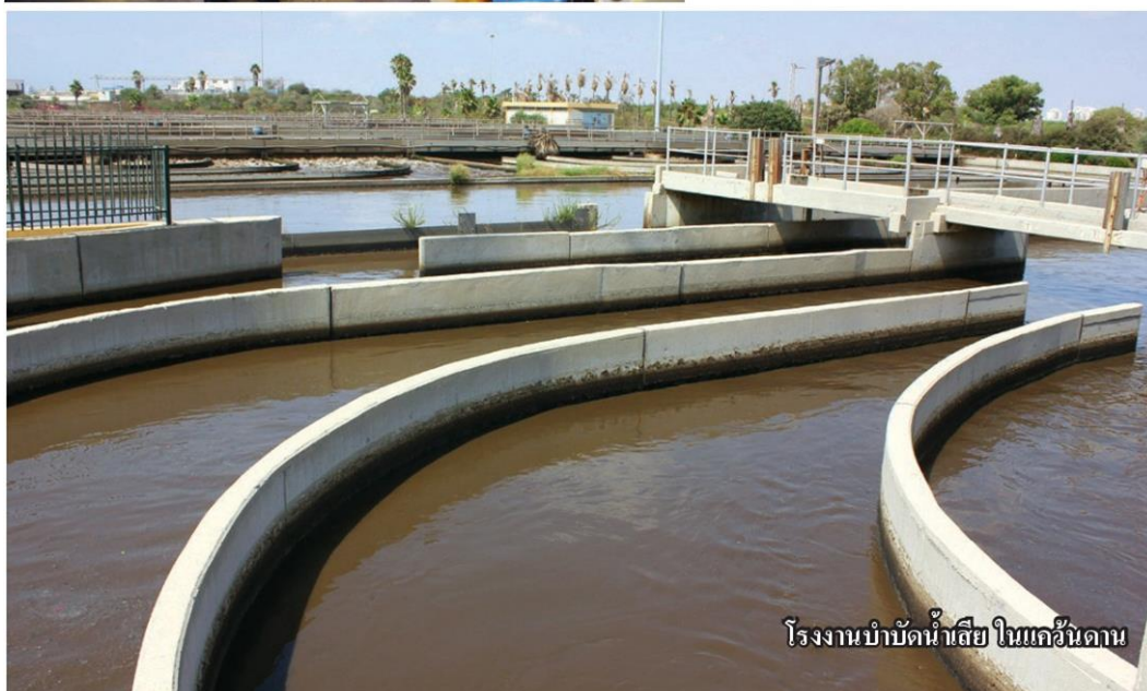
โรงงานบำบัดน้ำเสีย ในแคว้นดาน

โรงงานบำบัดน้ำเสีย แคว้นดาน ที่เข้าไปเยี่ยมชม มีขั้นตอนนำ น้ำเสียจากภาคครัวเรือนมาบำบัดให้เป็นน้ำดี และนำไปใช้ซ้ำอีก ครั้งในภาคเกษตร ขั้นตอนบำบัดค่อนข้างซับซ้อน เริ่มจากแยกของแข็ง ออกจากน้ำนำไปทำปุ๋ย จากนั้นปล่อยน้ำซึมลงดินอย่างช้าๆ ใช้ระบบ แรงดัน ใช้ระยะเวลาประมาณ 1 ปี เพราะจากการศึกษาจะมีน้ำซึม ลงดินได้ประมาณ 130,000 ม./วัน