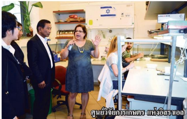
ศูนย์วิจัยการเกษตร แห่งอิสราเอล

2) ให้คำแนะนำและช่วยเหลือ เลือกพัฒนาประยุกต์ใช้เครื่องมือ อุปกรณ์อิเล็กทรอนิกส์ คอมพิวเตอร์และซอฟต์แวร์ ที่จะเชื่อมโยงและนำมาพัฒนาแผนที่เกษตรเพื่อการบริหารจัดการเชิงรุก หรือ