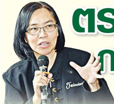
สมช.เกษตรฯ