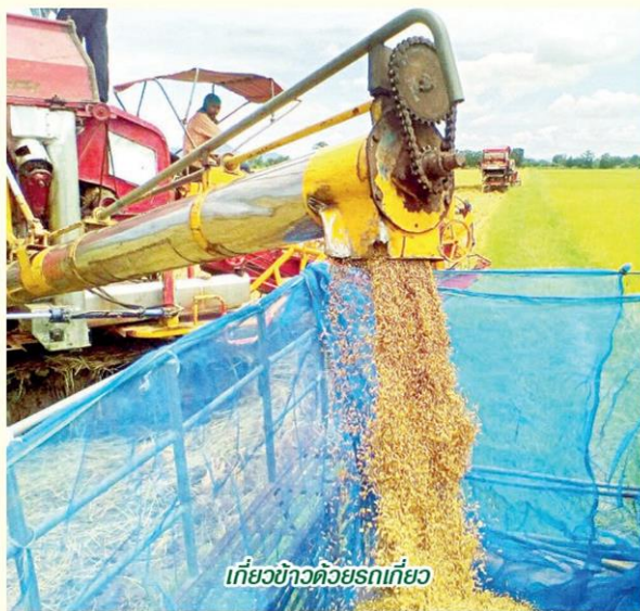
เกี่ยวข้าวด้วยรถเกี่ยว

ราย พื้นที่ 750,448 ไร่ รวม 748 แปลง ส่วนโครงการเชื่อมโยงการตลาดข้าวอินทรีย์และข้าว GAP ครบวงจร ขณะนี้มีการทำบันทึกความตกลงร่วมกัน (เอ็มโอยู) ระหว่างเกษตรกรในโครงการนาแปลงใหญ่กับโรงสีและวิสาหกิจชุมชน จาก 56 จังหวัด 537 ราย