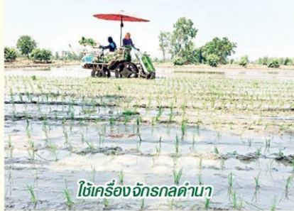
ใช้เครื่องจักรกลดำนา

เกษตรกร 30 กลุ่ม พื้นที่ 18,829 ไร่ และข้าวอินทรีย์ เชื่อมโยงตลาดแล้ว 66 กลุ่ม พื้นที่ 7,457 ไร่