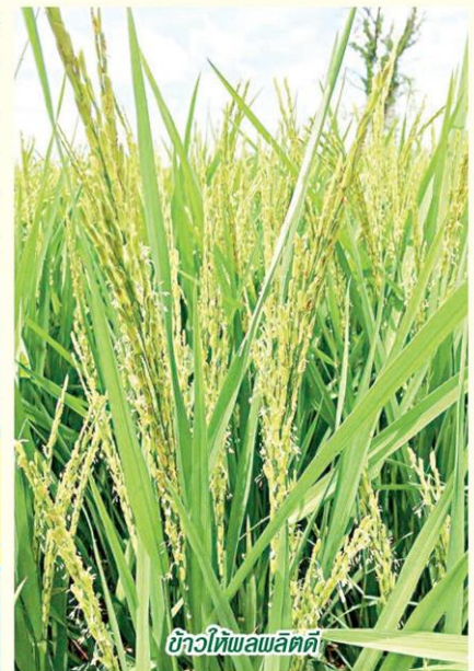
ข้าวที่พอผลิตดี

จังหวัดศรีสะเกษมีเกษตรกรเข้าร่วมโครงการส่งเสริมการผลิตข้าวอินทรีย์ 13 อำเภอ 37 กลุ่ม 919 ราย พื้นที่ 10,876.86 ไร่ โครงการนาแปลงใหญ่ จำนวน 5,382 ราย พื้นที่ 70,300 ไร่ รวม 22 แปลง