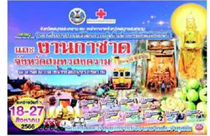
งานสืบสานประเพณีและวัฒนธรรม ลุ่มน้ำแม่กลอง และงานกาชาด จังหวัดสมุทรสงคราม

สวยงามน่าประทับใจ ระหว่างทางเดินสองข้างทางนักท่องเที่ยวสามารถเลือกซื้อสินค้า มีทั้งอาหาร เครื่องดื่ม ผักผลไม้ ขนมไทย และข้าวของเครื่องใช้ โดยมีพ่อค้าแม่ค้ามาวางขายทั้งในเรือและบนบกจำนวนมาก หรือจะเดินชมบ้านเรือนสองฟากฝั่งคลองก็ชวนให้เพลิดเพลินเช่นกัน