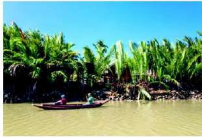
พายเรือเที่ยว ที่ชุมชนบ้านริมคลองโฮมสเตย์

จนถึงเป็นแลนด์มาร์กสำคัญที่ใครมาเยือนสมุทรสงครามก็ต้องแวะมาที่นี่ ตลาดน้ำอัมพวาเปิดให้บริการในวันศุกร์ เสาร์ อาทิตย์ และวันหยุดนักขัตฤกษ์ ตั้งแต่ช่วงเย็น ประมาณ 16.00-22.00 น. ซึ่งเป็นช่วงเวลาที่เหมาะสมแก่การเดินทางท่องเที่ยว เพราะอากาศไม่ร้อน เย็นสบาย สามารถเดินชิลๆ ดื่มด่ำกับบรรยากาศตลาดน้ำยามเย็นที่มีความ