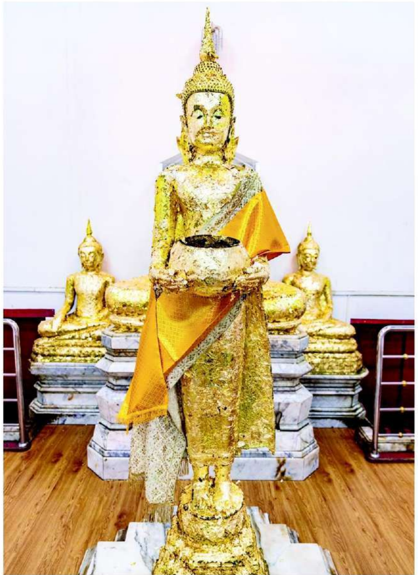
หลวงพ่อบ้านแหลม พระพุทธรูปคู่เมืองสมุทรสงคราม

จังหวัดสมุทรสงคราม ได้รับการขนานนามว่า เป็นเมืองสามน้ำ เพราะมีน้ำจืดและน้ำทะเลมาผสมผสานกันกลายเป็นน้ำกร่อย ทำให้การปลูกผลไม้ อย่างเช่น ลิ้นจี่ ส้มโอ มะพร้าว น้ำหอม มีรสชาติดี และกลายเป็นผลไม้ที่มีชื่อเสียงประจำจังหวัดสมุทรสงคราม สำหรับผู้สนใจ