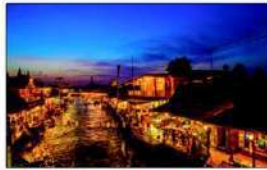
ท่องวิถีชุมชนงดงาม...