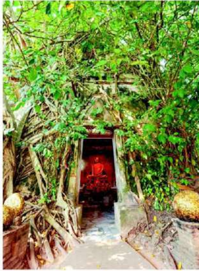
หลวงพ่อนิลมณี วัดบางกุ้ง

ซึ่งถูกต้นไม้ใหญ่ 4 ชนิด คือ ต้นโพธิ์ ต้นไทร ต้นไกร ต้นกร่าง ปกคลุมและมีรากยึดโอบสถให้คงรูปอยู่ได้ ชาวบ้านเชื่อกันว่า ถ้าได้เดินเข้าโอบสถแล้วสักการะหลวงพ่อนิลมณี จะทำให้ชีวิตพลิกผันจากร้ายกลายเป็นดี ซึ่งสถานที่แห่งนี้ได้รับความนิยมจากนักท่องเที่ยวจำนวนมากที่หลังไหลมาเยี่ยมเยือนอย่างต่อเนื่อง