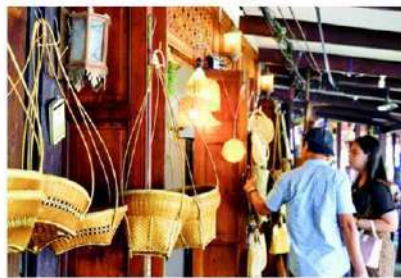
ตลาดน้ำบางน้อย อำเภอบางคนที

ส่วนคนชอบเรื่องราวประวัติศาสตร์ แนะนำให้ไปที่วัดบางกุ้ง ตำบลบางกุ้ง อำเภอบางคนที อยู่ใกล้ๆ กับตลาดน้ำอัมพวา เป็นวัดโบราณสมัยกรุงศรีอยุธยา ไฮไลต์ของวัดบางกุ้ง คือ การมาสักการะหลวงพ่อนิลมณี หรือหลวงพ่โอบสถน้อย หรือหลวงพ่อดำ เป็นพระพุทธรูปปางมารวิชัย สมัยอยุธยาตอนปลาย ที่อยู่ภายในพระอุโบสถของวัด