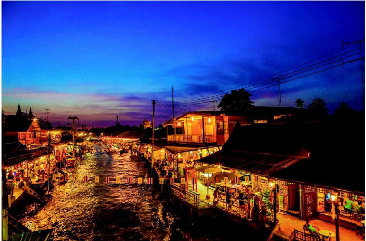
ตลาดน้ำอัมพวา จังหวัดสมุทรสงคราม

อีกกิจกรรมหนึ่งที่นิยมกันมาก คือ การล่องเรือชมหิ่งห้อย ซึ่งทางชุมชนตลาดน้ำอัมพวาจะมีการจัดรอบเรือไว้บริการส่วนใครที่ต้องการพักค้างคืนเพื่อชมบรรยากาศริมน้ำ ก็มีที่พักให้บริการอยู่หลายแห่ง และมีกิจกรรมตักบาตรพระที่พายเรือมาบิณฑบาตตอนเช้าอีกด้วย