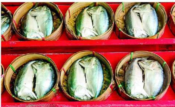
ปลาทุแม่กลอง ของแท้ต้อง "หน้าอ คอหัก"