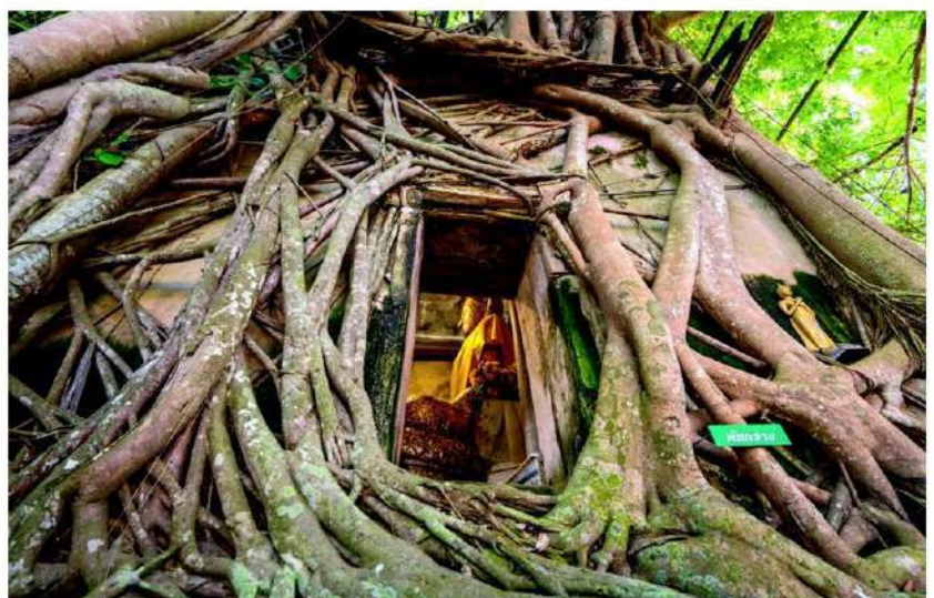
โบสถ์วัดบางกุ้ง ที่มีต้นไม้ใหญ่ปกคลุม

จะได้สัมผัสกับวิถีชีวิตแบบดั้งเดิมของชาวสวน ซึ่งจะพายเรือนำผลผลิต พืชผักผลไม้จากสวน เช่น พริก หอม กระเทียม น้ำตาลมะพร้าว ฝรั่ง มะพร้าว ชมพู่ ส้มโอ กล้วย ตลาดท่าคาจะเปิดทุก 5 วัน ตามวันขึ้นหรือแรม 2 ค่ำ 7 ค่ำ และ 12 ค่ำ เปิดในวันเสาร์-อาทิตย์ ตั้งแต่เวลา 06.00 น.