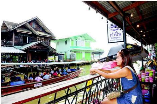
นักท่องเที่ยวชมบรรยากาศตลาดน้ำอัมพวา

สวยงามน่าประทับใจ ระหว่างทางเดินสองข้างทางนักท่องเที่ยวสามารถเลือกซื้อสินค้า มีทั้งอาหาร เครื่องดื่ม ผักผลไม้ ขนมไทย และข้าวของเครื่องใช้ โดยมีพ่อค้าแม่ค้ามาวางขายทั้งในเรือและบนบกจำนวนมาก หรือจะเดินชมบ้านเรือนสองฟากฝั่งคลองก็ชวนให้เพลิดเพลินเช่นกัน