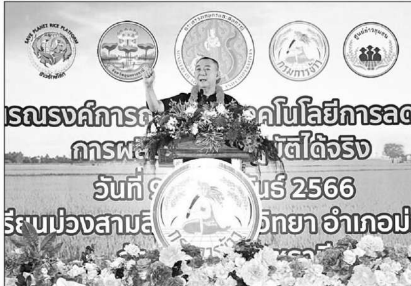
พบปะ : ดร.เฉลิมชัย ศรีอ่อน รมว.เกษตรและสหกรณ์ พบปะสมาชิกศูนย์ข้าวชุมชนและเป็นประธานเปิดงานรณรงค์การถ่ายทอดเทคโนโลยีลดต้นทุนการผลิตข้าวให้ปฏิบัติได้จริง ที่โรงเรียนม่วงสามสิบอัมพวันวิทยา จ.อุบลราชธานี รณรงค์ให้เกษตรกรตระหนักถึงความสำคัญของการลดต้นทุนการผลิตข้าว

สนับสนุนองค์ความรู้เทคโนโลยีและนวัตกรรมที่จะทำให้เกิดการลดต้นทุนการผลิตข้าวแก่เกษตรกรพี่น้องชาวนาทุกท่านให้สามารถนำไปปฏิบัติจริง ได้เสริมสร้างความรู้และสิ่งสมประสงค์ก่อให้เกิดความเข้มแข็ง มีรายได้ที่มั่นคงและยั่งยืน นอกจากนี้ยังเน้นการเพิ่มผลผลิตข้าวการยกระดับคุณภาพผลผลิตข้าวสนองความต้องการของตลาด และการปรับระบบการผลิตข้าวให้เป็นมิตรกับสิ่งแวดล้อม โดยเชื่อมั่นว่าแนวทางการลดต้นทุนการผลิตนี้จะสร้างผลประโยชน์แก่เกษตรกร ช่วยให้เรียนรู้และวางแผนการทำงานอย่างเป็นระบบตลอดห่วงโซ่อุปทาน ช่วยลดต้นทุนการผลิต เพิ่มประสิทธิภาพการผลิต ยกระดับคุณภาพผลผลิตเกษตรกรมีความรู้เรื่องการตลาดสินค้าเกษตร สามารถผลิตสินค้าได้ตามที่ตลาดต้องการ ซึ่งภาครัฐสามารถช่วยกำหนดตลาดล่วงหน้าได้และสอดคล้องกับทิศทางเปลี่ยนแปลงของโลกที่ให้ความสำคัญกับการผลิตที่ต้องเป็นมิตรต่อสิ่งแวดล้อม การผลักดันการแปรรูปสินค้าเกษตรมูลค่าสูงการใช้การตลาดสมัยใหม่