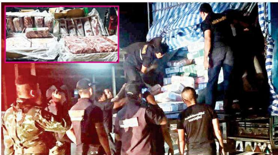
▲ เนื้อเถื่อน...จนท.ด่านกักกันสัตว์ประจวบคีรีขันธ์ กรมปศุสัตว์ ตร.สภ.ห้วยยาง และหน่วยงานเกี่ยวข้องสกัดจับการขนย้ายเนื้อเถื่อน (ภาพเล็ก) ที่ด่านตรวจความมั่นคง หมู่ 1 ต.ห้วยยาง อ.ทับสะแก จ.ประจวบคีรีขันธ์

การจับกุมครั้งนี้เป็นไปตามนโยบายของนายไชยา พรหมา รมช.เกษตรและสหกรณ์ ที่กำกับดูแลกรมปศุสัตว์ได้สั่งการให้ตรวจสอบและปราบปรามการขนสินค้าเถื่อนโดยเฉพาะเนื้อสัตว์เข้ามาในประเทศไทย จึงประสานไปยัง กอ.รมน.จังหวัดประจวบคีรีขันธ์ ให้มีการตรวจสอบกระทั่งได้รับแจ้งว่าจะมีขบวนการลักลอบขนเนื้อสัตว์เถื่อนผ่านด่านกักกันสัตว์ จึงร่วมกันสืบสวนหาจำวนทราบแน่ชัดว่า