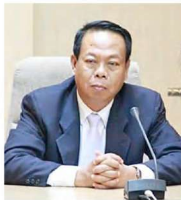
วีระศักดิ์ วิทยาลัยเมือง

ทั้งนี้ แม้อ้อยผลผลิตในฤดูหีบปี 2566/67 จะกระตือรือร้นแต่หากเทียบกับผลผลิตอ้อยในปี 2565/66 อยู่ที่ 93.88 ล้านตัน ก็ยังคงถือว่าปริมาณผลผลิตอ้อยยังคงปรับลดลง อย่างไรก็ตาม ขณะนี้ราคาน้ำตาลทรายดิบตลาดโลกยังคง