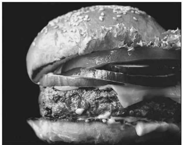
วัสดุเหลือใช้มาต่อยอดให้กลายเป็นงานชิ้นใหม่ขึ้นมา

ด้วยเหตุนี้เองในยุคนี้จึงเกิดคำนิยามใหม่ของ อุตสาหกรรมสิ่งทอ นั่นก็คือ เซอร์คูลาร์แฟชั่น หรือการทำให้อุตสาหกรรมแฟชั่นนั้นเกิดความยั่งยืนและลดผลกระทบต่อโลกและสิ่งแวดล้อม โดยมุ่งเน้นให้เป็น "แฟชั่นหมุนเวียน" ตามแนวคิดเศรษฐกิจหมุนเวียน โดยมีแนวทางปฏิบัติที่มุ่งเน้นสิ่งที่เป็นมิตรกับสิ่งแวดล้อม อาทิ การใช้วัสดุที่เป็นมิตรต่อสิ่งแวดล้อม การใช้พลังงานสะอาดในกระบวนการผลิต รวมไปถึงถึงปัญหาหลักคือการลดใช้น้ำ และขั้นตอนในฝั่งของผู้ใช้ อย่างเช่น การยืดอายุของเสื้อผ้าด้วยการซ่อมแซม การรีไซเคิล และการอัปเดตสิ่งที่น่าสนใจ