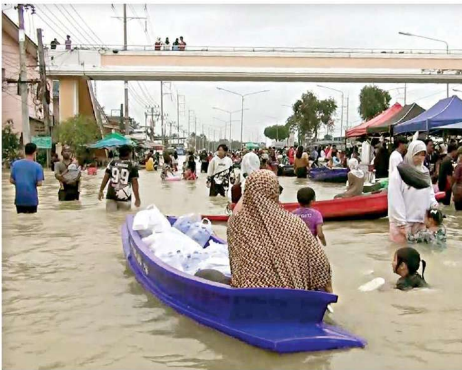
▲ท่วมวิกฤติ...ประชาชนชาวปัตตานีเดือดร้อนลุยน้ำท่วมขัง แม้เรือสัญจรแทนรถยนต์ในย่านชุมชนกลางเมือง ขณะที่มวลน้ำเขื่อนบางลางยังไหลทะลักเข้ามาอย่างต่อเนื่อง ทำให้สถานการณ์เลวร้ายมากขึ้นทุกที

เมื่อวันที่ 30 ธ.ค. นายสุรสีห์ กิตติมณฑล เลขาธิการสำนักงานทรัพยากรน้ำแห่งชาติ (สทนช.) เปิดเผยว่า ภาพรวมของประเทศไทยและทะเลจีนใต้มีกำลังอ่อนลง ทำให้บริเวณประเทศไทยอุทกภัยจะสูงชัน 1-2 องศาเซลเซียส สำหรับมรสุมตะวันออกเฉียงเหนือกำลังปานกลางพัดปกคลุมอ่าวไทยและภาคใต้ ทำให้ภาคใต้ตอนล่างมีฝนฟ้าคะนองบางแห่ง คาดการณ์ ในวันที่ 31 ธ.ค 66-2 ม.ค. 67 มรสุมตะวันออก