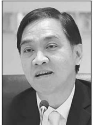
กีรติ รัชโน

นายกีรติ กล่าวว่า กระทรวงพาณิชย์ได้ตั้งเป้าหมายการส่งออกปี 2567 โดยเป็นเป้าหมายไว้ที่ ขยายตัว 1-2% มูลค่า 280,000-290,000 ล้านดอลลาร์สหรัฐ หรือ 9.8-10 ล้านล้านบาท โดย